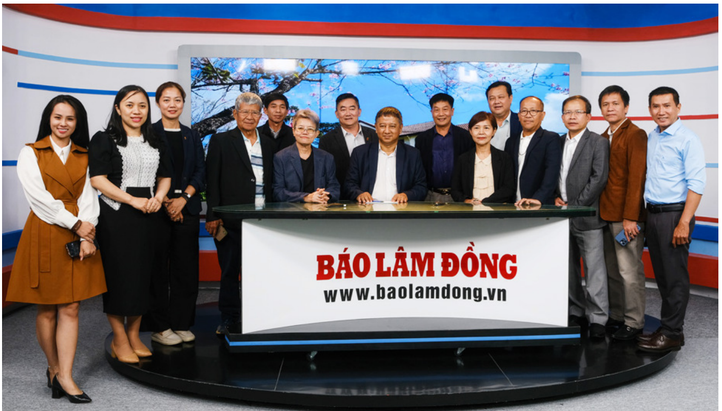
Đoàn tham quan phòng ghi hình của Báo điện tử Lâm Đồng.

Trong khuôn khổ chuyến thăm và làm việc tại Lâm Đồng, Liên đoàn các nhà báo Thái Lan cũng đã tham quan Đài Phát thanh - Truyền hình Lâm Đồng và Báo Lâm Đồng.