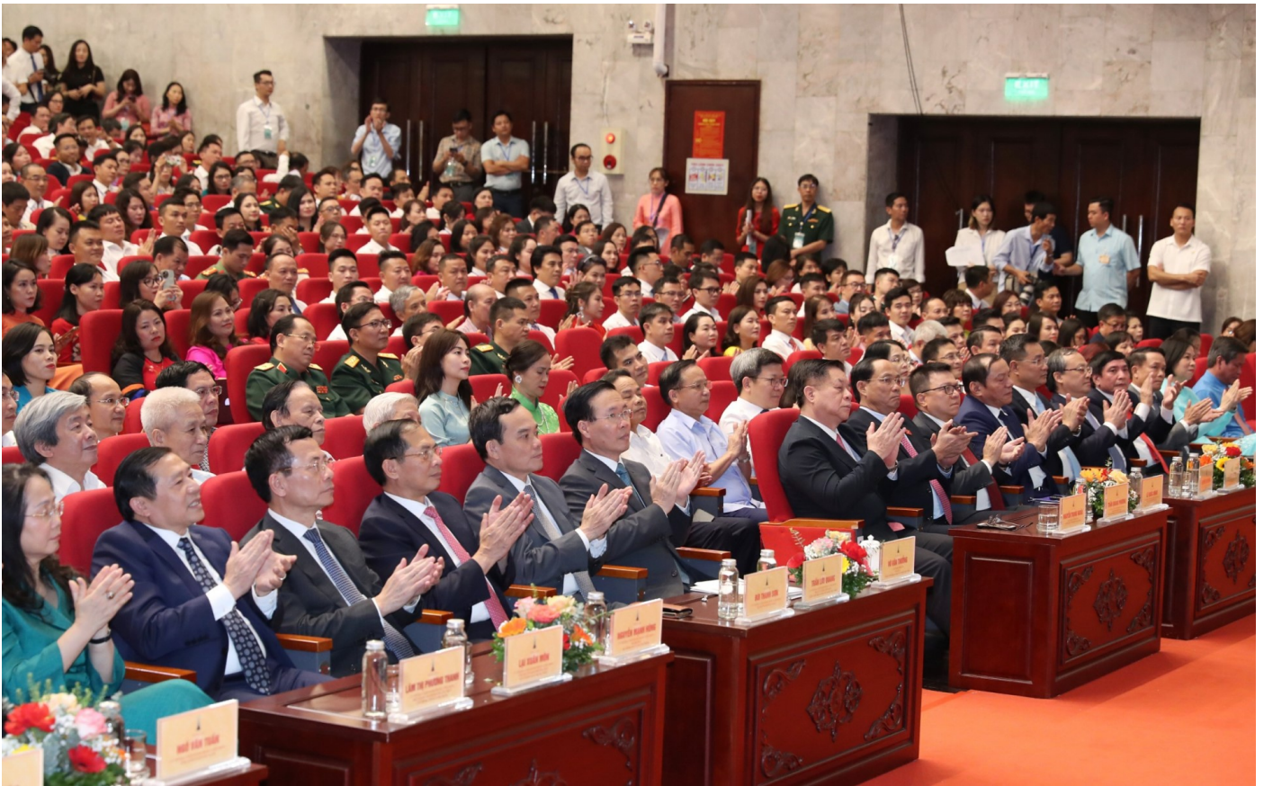
Các đại biểu tham dự lễ trao giải.

Giải báo chí Quốc gia là giải thưởng cao quý nhất dành tặng các tác phẩm báo chí xuất sắc, có đóng góp tích cực cho sự nghiệp báo chí nước nhà, tôn vinh các tác giả, nhóm tác giả có tác phẩm xuất sắc nhất trong năm.