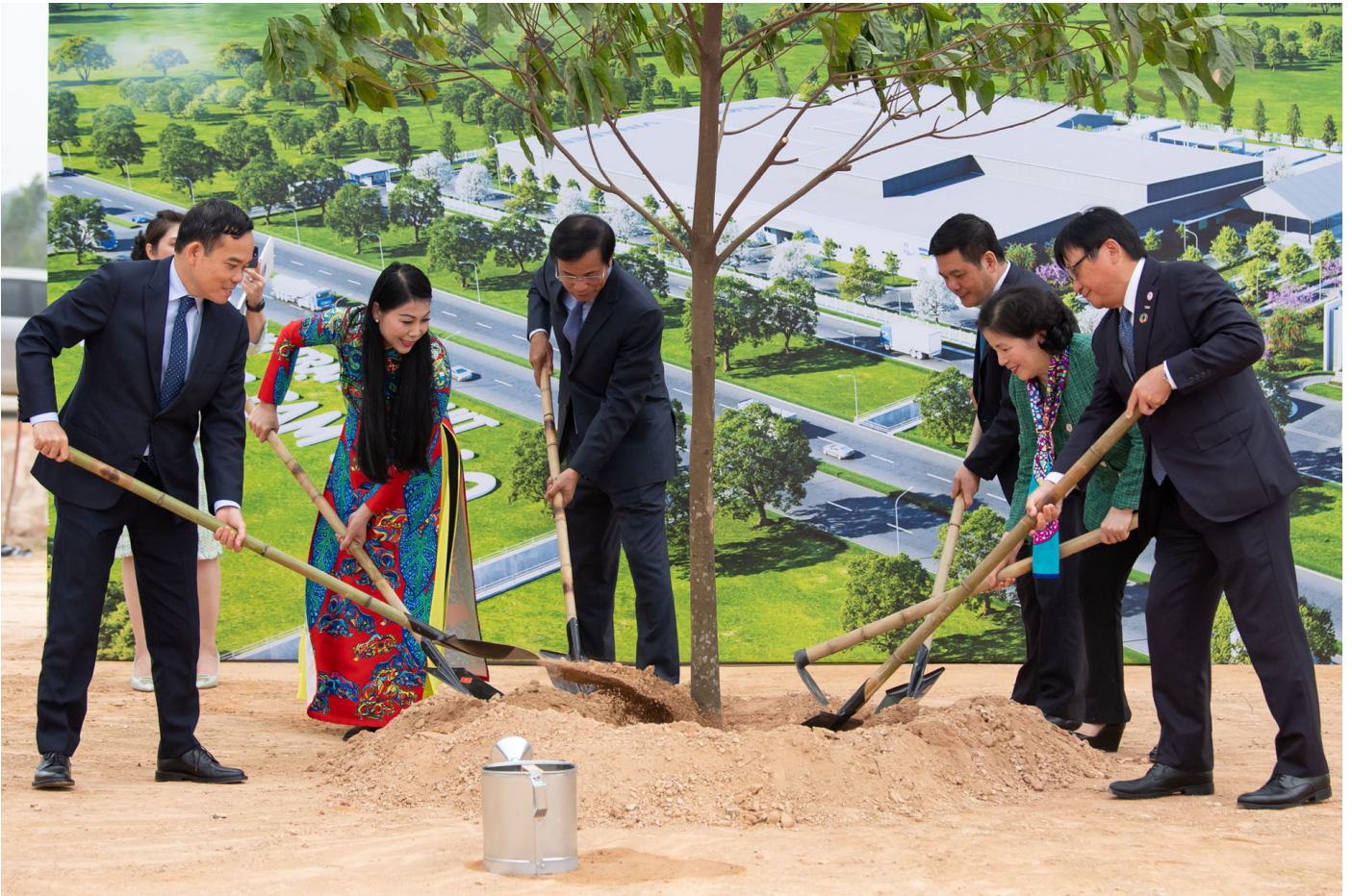
Các đại biểu trồng cây lưu niệm tại khuôn viên dự án

Cũng tại buổi lễ, ông Vũ Chí Giang – Phó Chủ tịch UBND tỉnh Vĩnh Phúc cho hay, Dự án Vinabeef Tam Đảo là dự án nông nghiệp công nghệ cao có vốn đầu tư lớn nhất trên địa bàn tỉnh tính đến nay và được đầu tư xây dựng bởi các tập đoàn hàng đầu của hai nước. Với tiềm lực sẵn có, Tỉnh sẽ đồng hành và tạo điều kiện thuận lợi, hợp pháp để giúp các doanh nghiệp triển khai các dự án tại địa phương thuận lợi, hiệu quả.