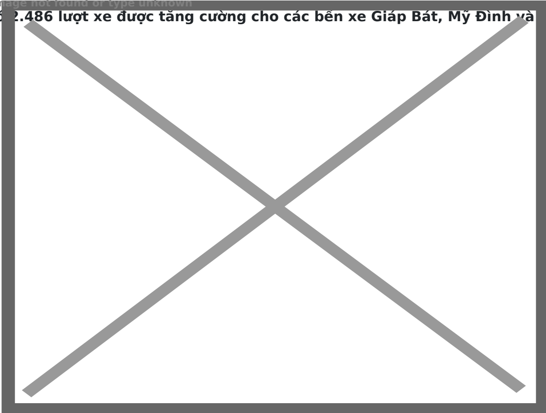
Quang cảnh bến

Để phục vụ nhu cầu đi lại của người dân trong dịp Tết Dương lịch, Tết Nguyên đán, Công ty Cổ phần Bến xe Hà Nội đã xây dựng kế hoạch phục vụ cao điểm đi lại. Trong đó, có 2.486 lượt xe được tăng cường cho các bến xe Giáp Bát, Mỹ Đình và Gia Lâm.