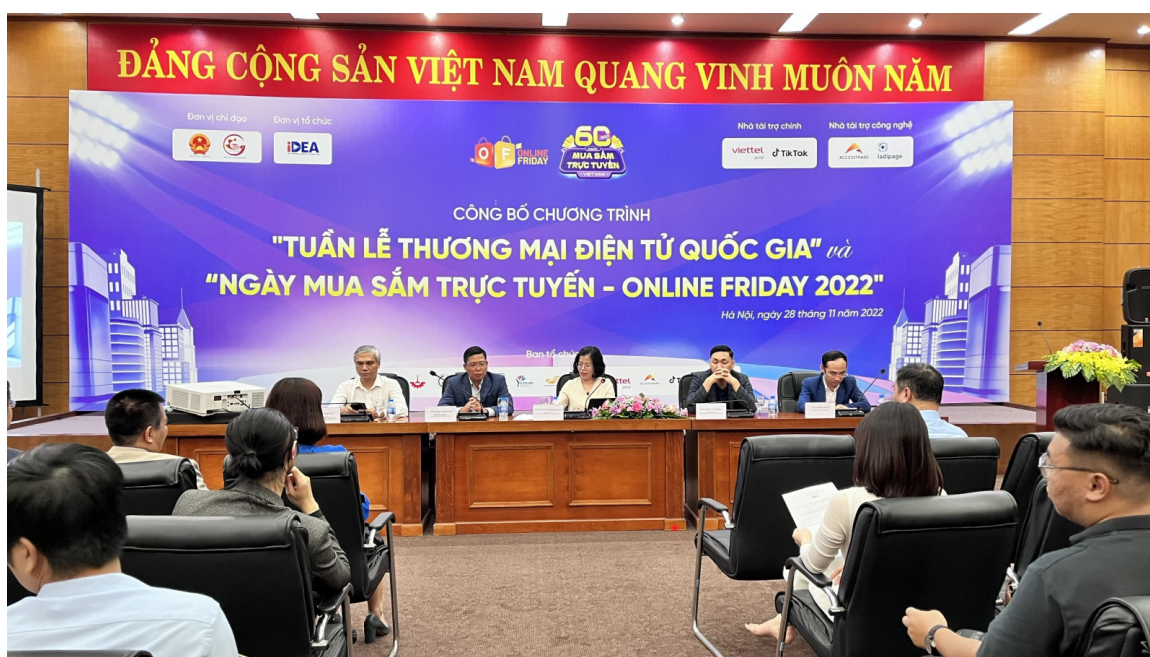
Công bố chương trình Tuần lễ thương mại điện tử quốc gia.

Ngày 28/11/2022, Bộ Công thương, Cục Thương mại điện tử và Kinh tế số đã tổ chức Hội báo giới thiệu và cung cấp thông tin về Chương trình Tuần lễ Thương mại điện tử quốc gia và Ngày mua sắm trực tuyến Online Friday 2022. Tuần lễ TMĐT quốc gia sẽ diễn ra từ ngày 28/11 đến 04/12, trong đó ngày Thứ 6 đầu tiên của tháng 12 (02/12) sẽ là Ngày mua sắm trực tuyến lớn nhất trong năm.