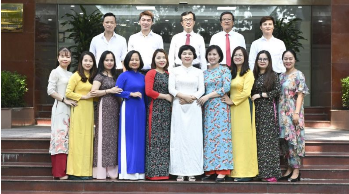
Thập th? cán b?, gi?ng viên Vi?n Báo chí hi?n nay.

Năm 2018 – 2019, thành lập Viện Báo chí, mô hình báo chí - nghiên cứu báo chí truyền thông hiện đại, đa ngành, đa phương tiện.