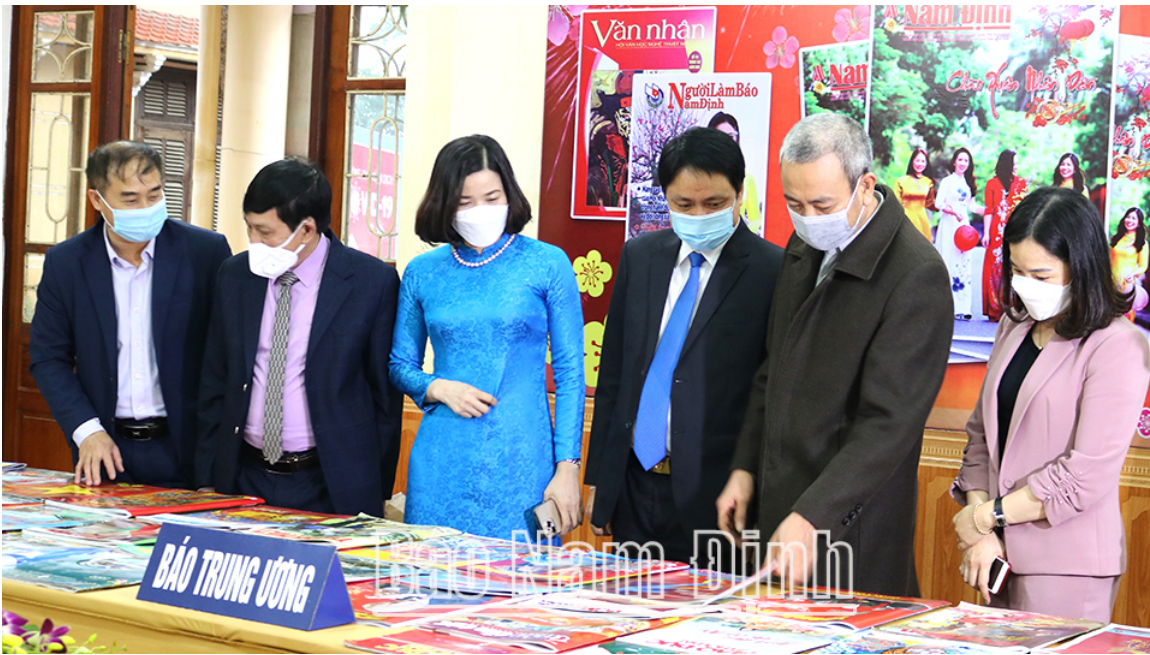
Các đại biểu tham quan gian trưng bày triển lãm lãm báo Xuân tỉnh Nam Định.

các cơ quan báo chí truyền thông của Hội, hỗ trợ Báo Nhà báo và Công luận và Tạp chí Người Làm Báo để chủ động bắt nhịp, xây dựng các đề án phát triển theo kịp xu hướng chuyển đổi số mạnh mẽ hiện nay.