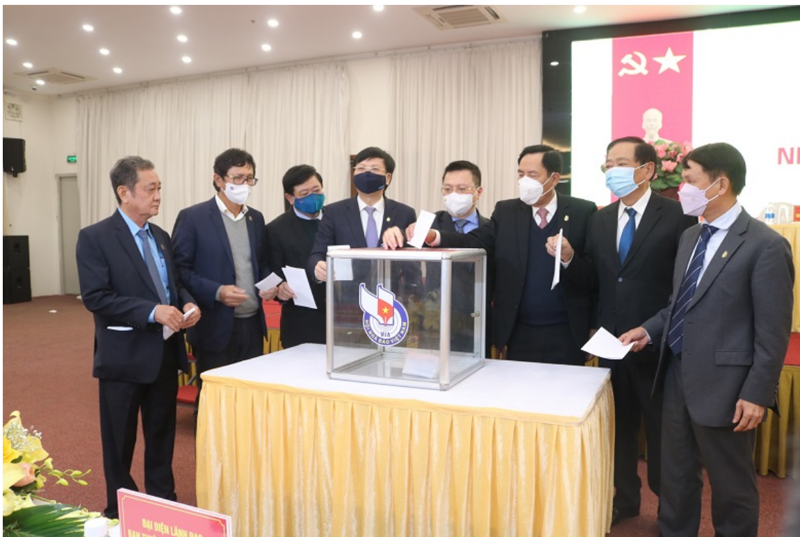
Các đại biểu bỏ phiếu bầu tại Đại hội XI Hội Nhà báo Việt Nam.

Bên cạnh việc xác định phương hướng, nhiệm vụ quan trọng cho nhiệm kỳ 2020–2025, Đại hội XI Hội Nhà báo Việt Nam đã bầu ra Ban Chấp hành gồm 52 nhà báo tâm huyết với nghề báo, không những giỏi kiến thức nghiệp vụ báo chí mà còn am hiểu về hoạt động Hội. Chủ tịch Hồ Chí Minh từng khẳng định: “Cán bộ là cái gốc của mọi công việc”, “Muôn việc thành công hay thất bại đều do cán bộ tốt hoặc kém”, việc lựa chọn đúng các thành viên Ban Chấp hành là điều kiện quan trọng trong quyết định, triển khai mọi hoạt động của Hội trong thời gian tới.