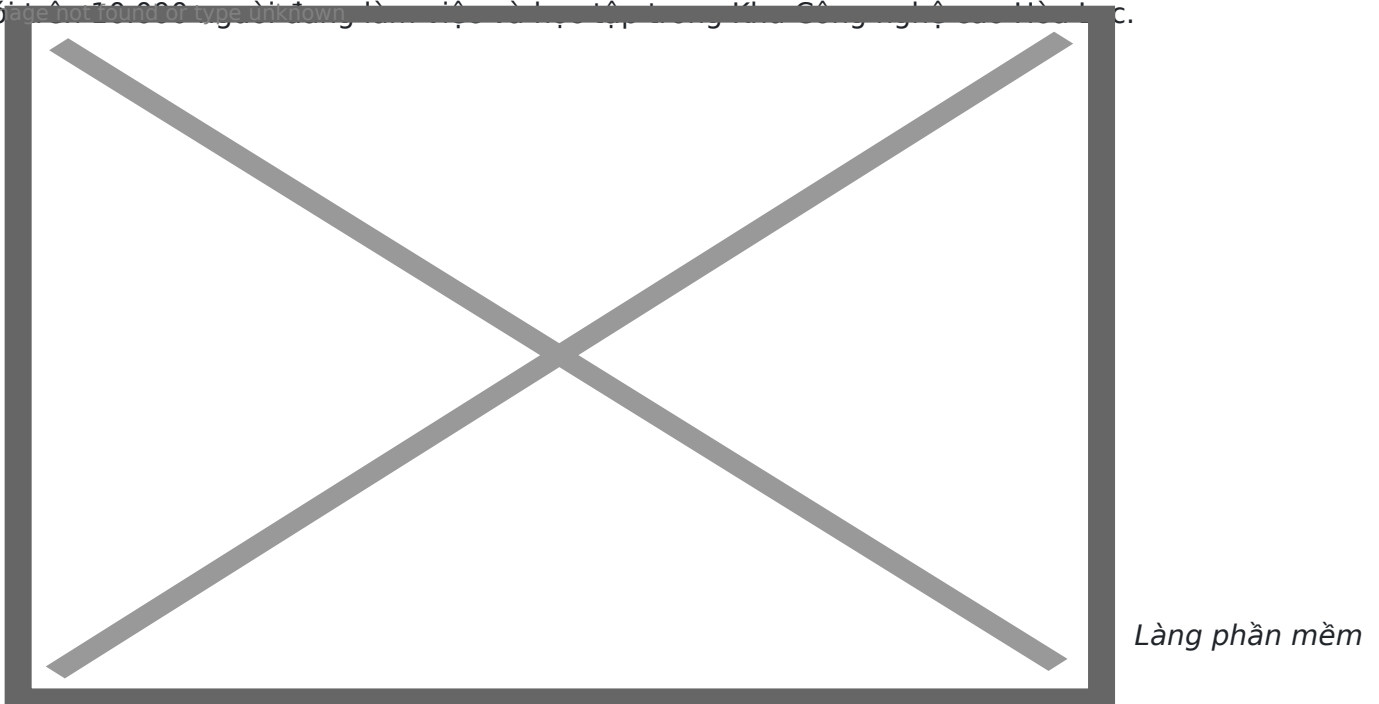
tại Khu công nghệ cao Hòa Lạc

Với mục đích xây dựng và phát triển trở thành một thành phố khoa học và công nghệ, một đô thị sinh thái và thông minh, trong thời gian gần đây, KCNC Hòa Lạc đã đạt được những kết quả đáng khích lệ. Tại Khu CNC Hòa Lạc, hiện có 78 dự án với tổng vốn đầu tư đăng ký 60.019 tỷ đồng (tương đương khoảng 3 tỷ USD) trên tổng diện tích 348 ha, trong đó có 36 dự án đang hoạt động với tổng vốn đầu tư đăng ký 10.000 tỷ đồng.