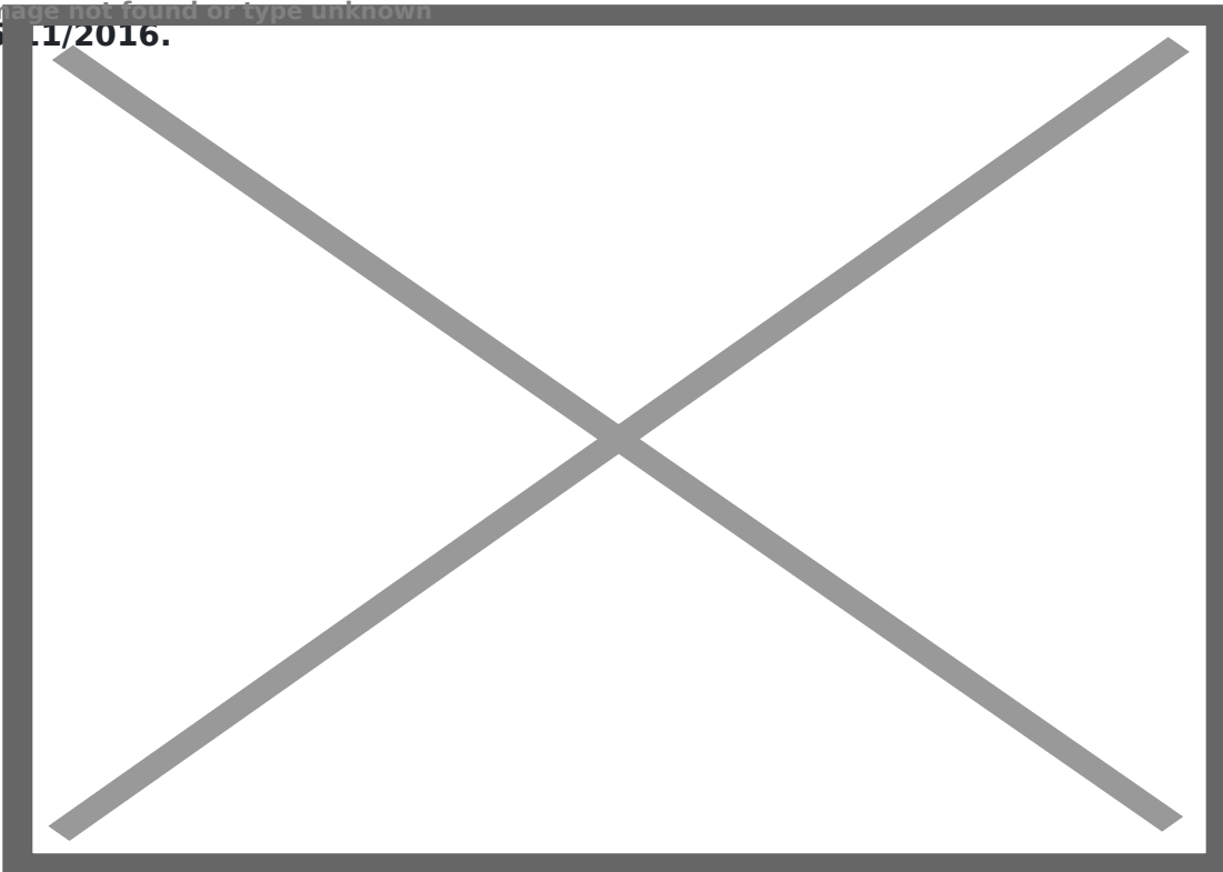
Quang cảnh hội