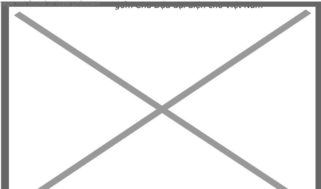
Image not found or type unknown gồm của Bồ Đào đại diện cho Việt Nam